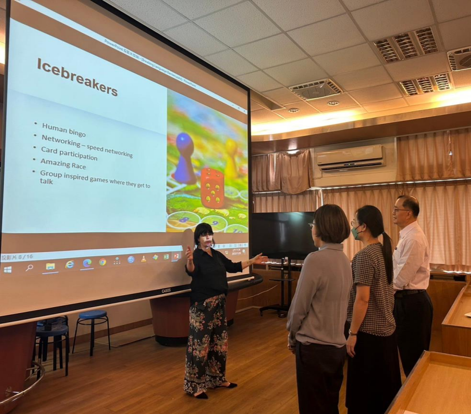
加拿大漢堡大學DR.ANKE教學分享會