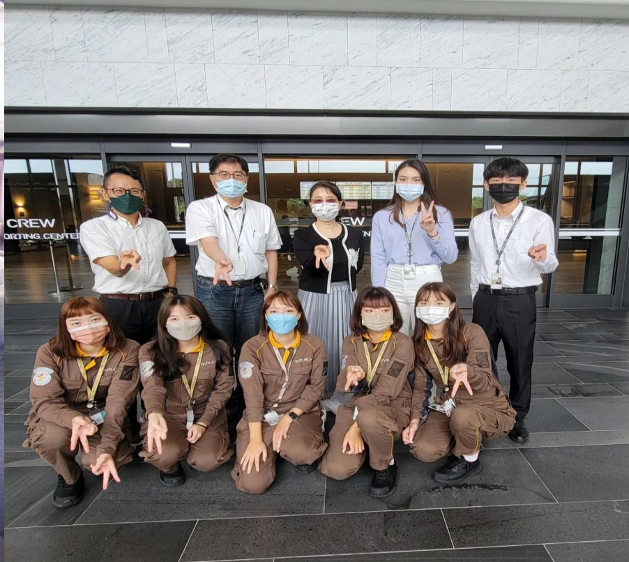
航空暨運輸服務管理系 星宇航空實習