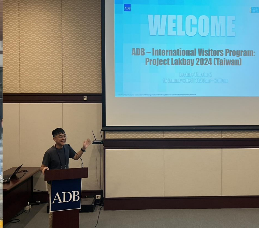
學生參加2024年菲律賓海外冬令營