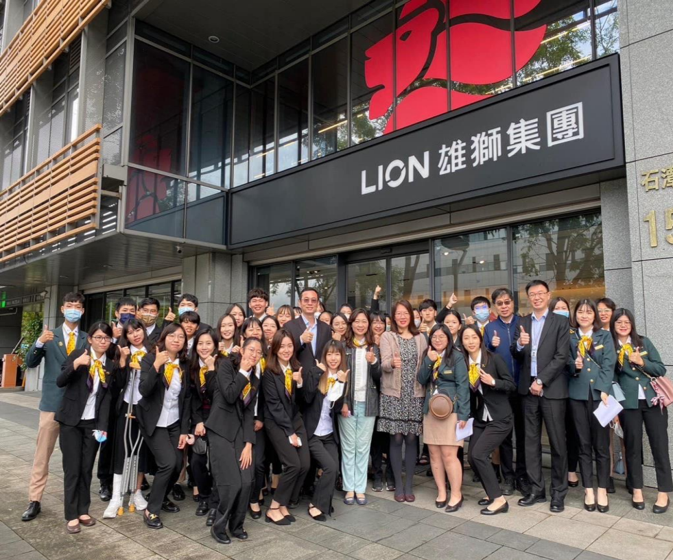
觀光學院台北雄獅集團總部參訪