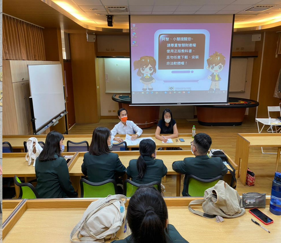
雄獅企業學苑舉辦校外實習面試活動