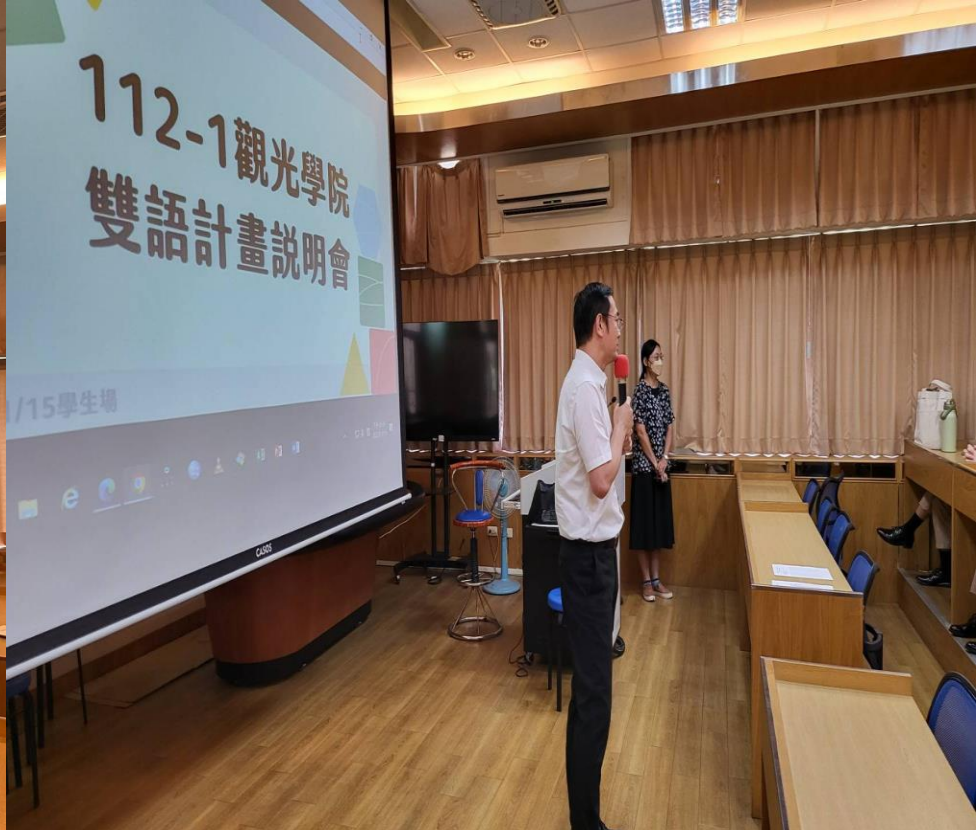
觀光學院辦理雙語計畫說明會