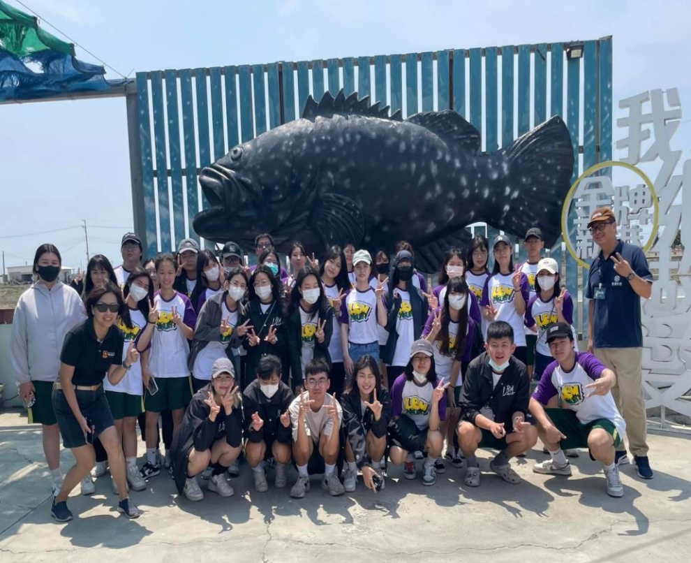
休閒暨遊憩管理系 安心石斑漁場體驗