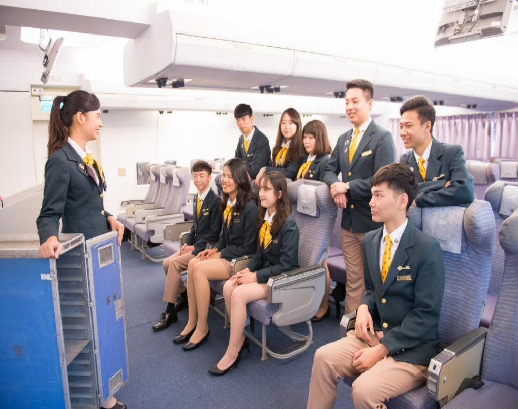
航空暨運輸服務管理系 航空客艙服務學習課程