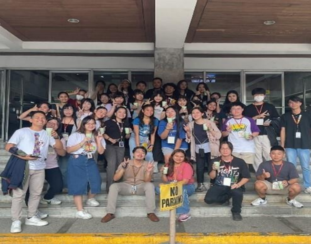
學生參加菲律賓理工大學海外研習活動