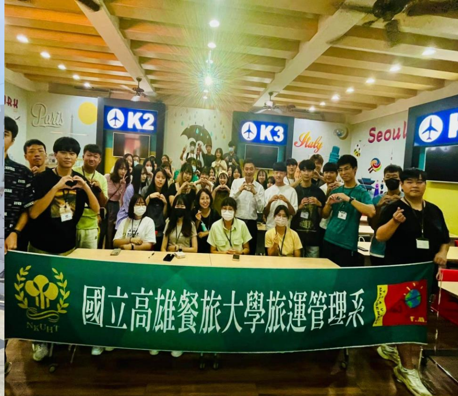
旅運管理系 辦理新生基礎銜接課程